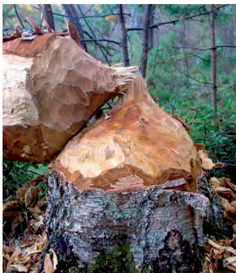
En bever kan gjøre store ødeleggelser i naturen.