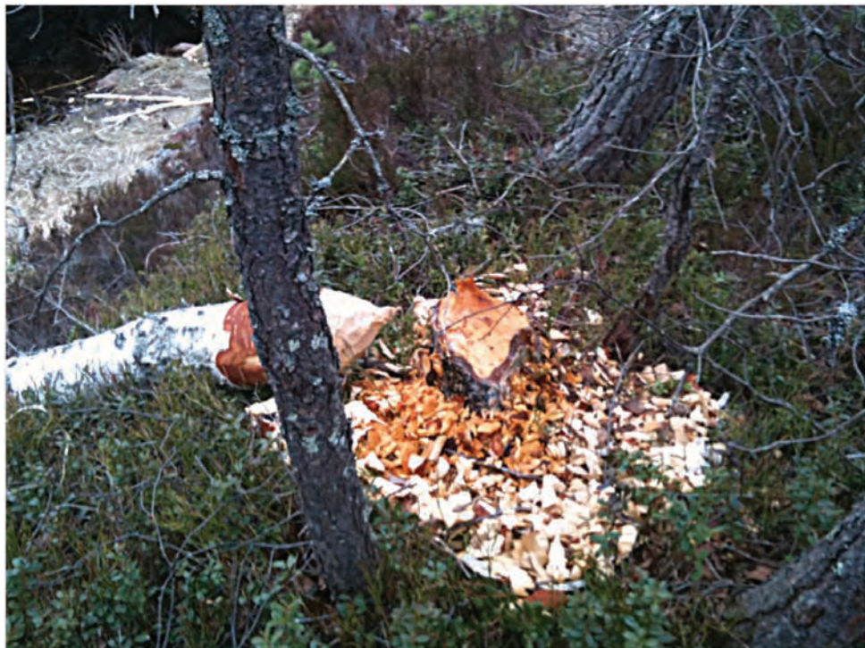
I den øverste enden av Spjotvatn, mot Løytesdalen har beveren tatt for seg av bjørkeskogen. I området finnes det beverhytter.